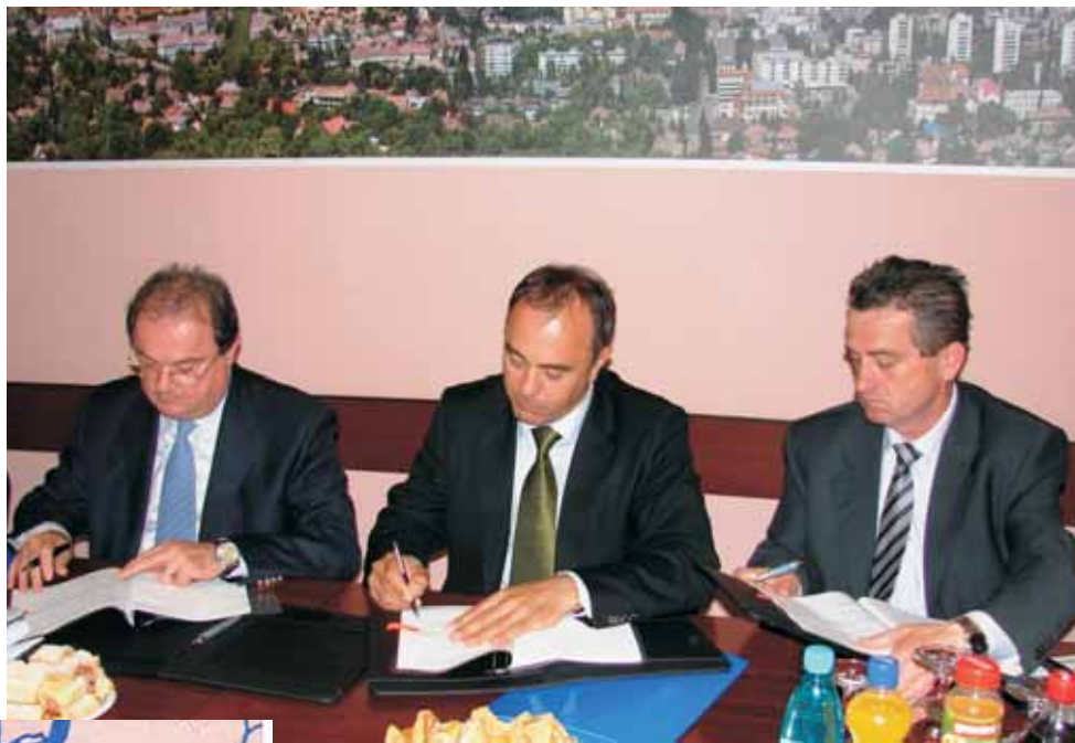
Regională Centru și a domnului Dorin Florea, primarul municipiului Tîrgu Mureș.

Peste 50 milioane de lei fonduri nerambursabile, vor fi acordate Municipiului Tîrgu Mureș pentru modernizarea străzilor. Fondurile sunt alocate prin Programul Operațional Regional, Axa prioritară 2, domeniul major de intervenție 2.1, ce prevede reabilitarea și modernizarea rețelei de drumuri județene, străzi urbane - inclusiv construcția și reabilitarea șoselelor de centură. Semnarea contractului de finanțare a proiectului „Modernizare străzi în Tîrgu Mureș”, prin care sunt solicitate fondurile, a avut loc în data de 15 mai 2009, la sediul Primăriei Tîrgu Mureș, în prezența domnului Vasile Blaga, Ministrul Dezvoltării Regionale și Locuinței, a domnului Simion Crețu, director general Agenția pentru Dezvoltare