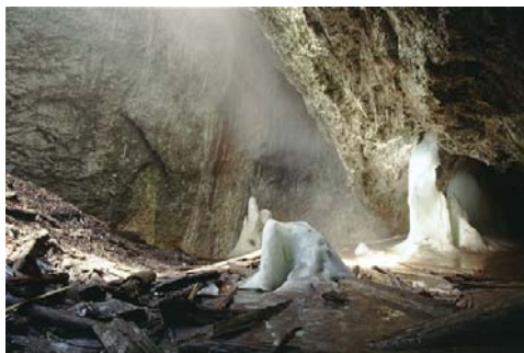
Pestera Vocul Viu