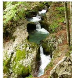
Cheile Galbenei-Muntii Apuseni