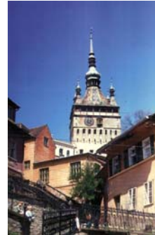
Turnul cu Ceas