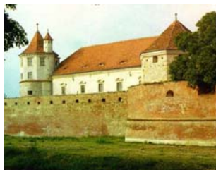
Muzeul "Valeriu Literatu"