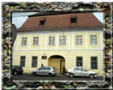
Muzeul Sebes-Casa Zapolya