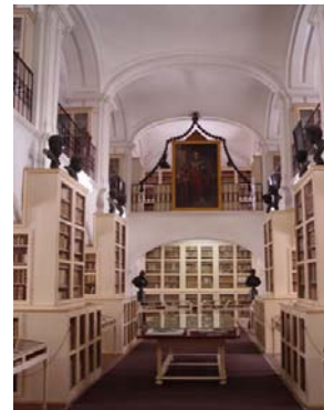
Casa Teleki-detaliu din interior