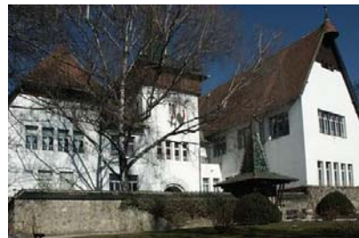
Muzeul Național Secuiesc