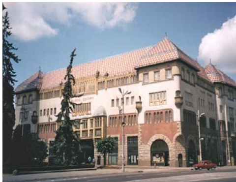
Casa de Cultura