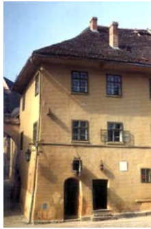
Casa "Vlad Dracu"

spatiale, fortificatiile păstrându-se în proporție de 90%, comparativ cu alte centre urbane transilvănene: Sibiu, Brasov-care păstrează doar în parte structura fortificațiilor medievale originale ( Sibiu aproape 30%, Brasov 45%). Este inclus pe lista monumentelor UNESCO.